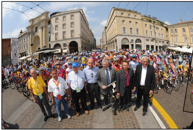
Alcune cartoline dalla 17ª edizione Foto Rodella